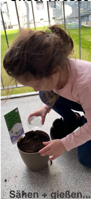
Sähen + gießen...